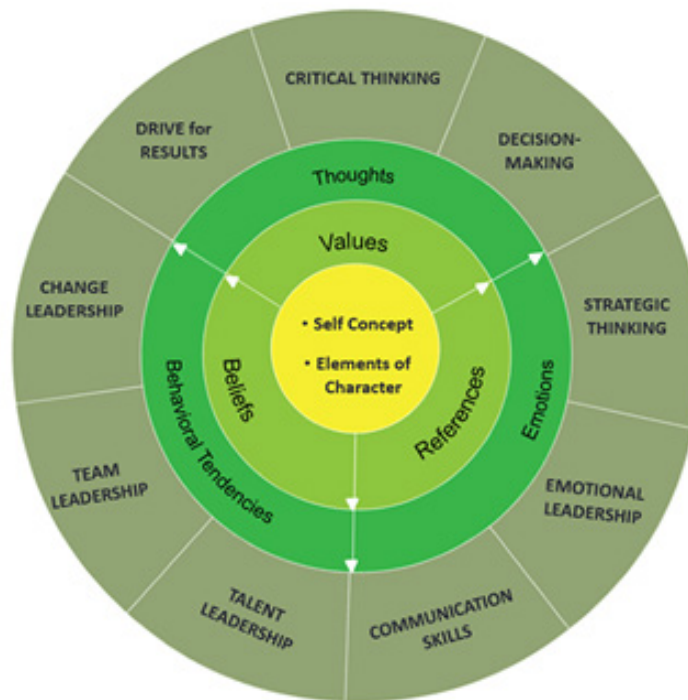
La rueda del Liderazgo Inteligente

Aquí podemos ver como el núcleo central nos lleva al núcleo externo que a su vez nos lleva a las 4 A's: