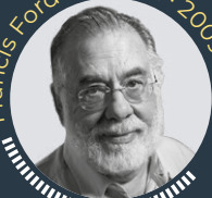
Francis Ford Coppola · 2009