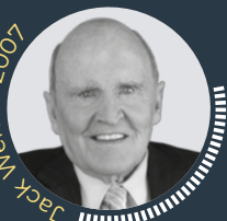
Jack Welch · 2007