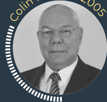
Colin Powell · 2005