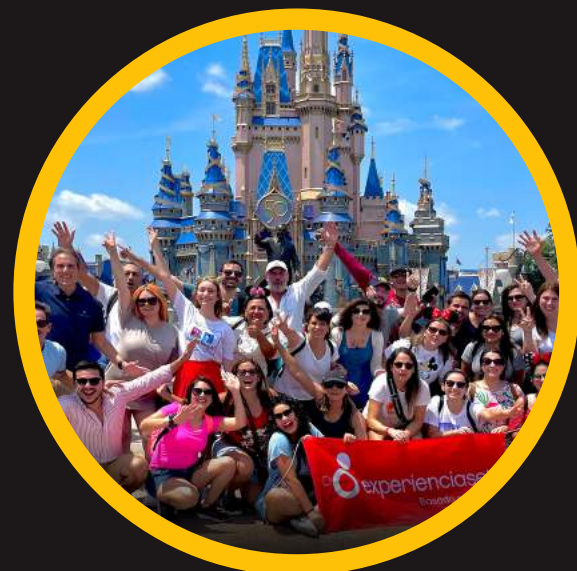
Edición 11 jun 2022

Reconocidos como los traductores de la cultura Disney® al mundo empresario LatAm.