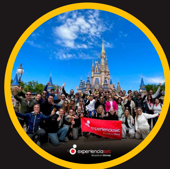
Edición 14 mar 2023