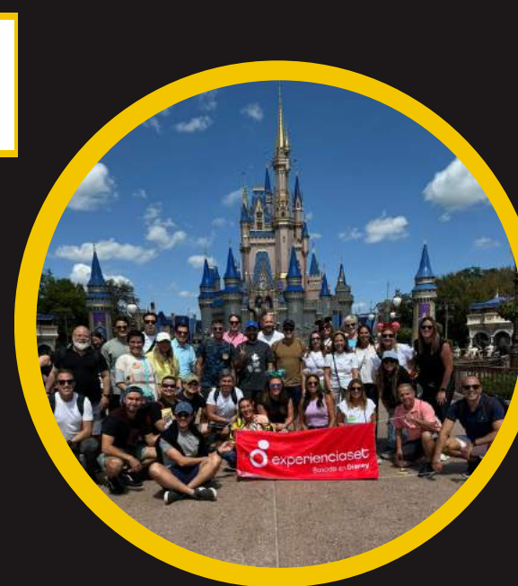
Edición 20 mar 2024