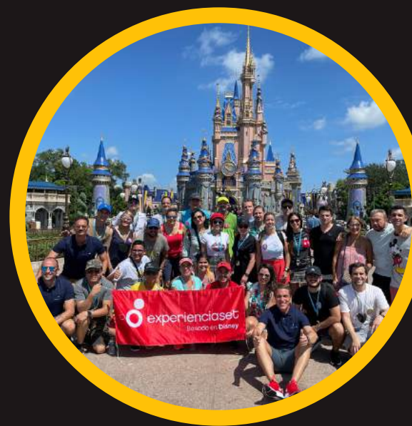
Edición 6 sept 2021