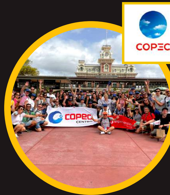
Edición 9 abr 2022 2do COPEC