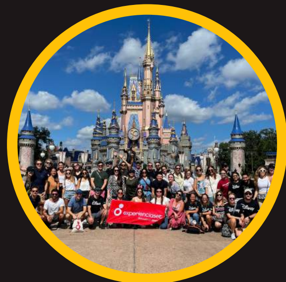
Edición 12 oct 2022