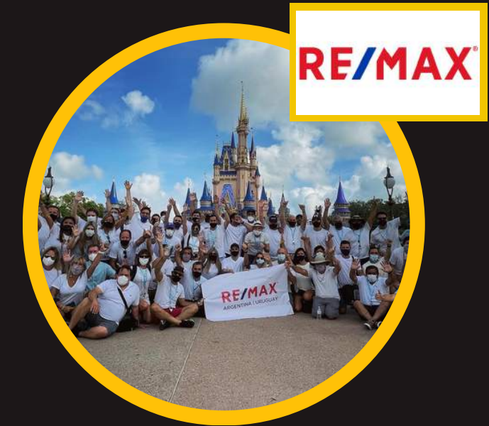
Edición 5 abr 2021 incompany RE/MAX