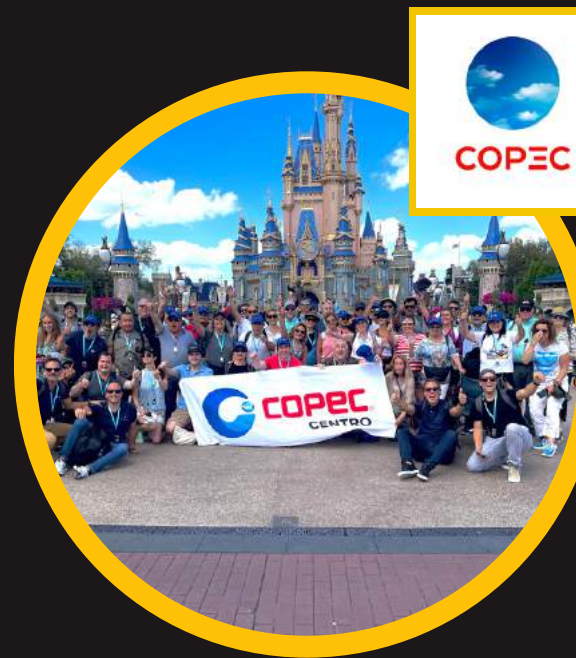
Edición 7 mar 2022 1ro COPEC