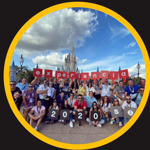
Edición 2 feb 2020