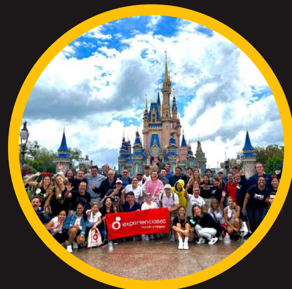
Edición 15 jun 2023