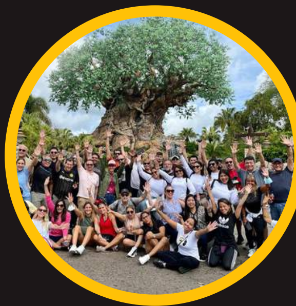
Edición 8 mar 2022