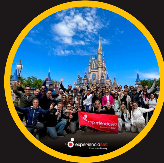
Edición 14 mar 2023