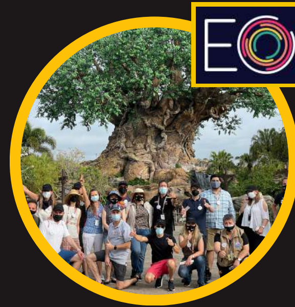
Edición 3 mar 2021 incompany EO LatAm