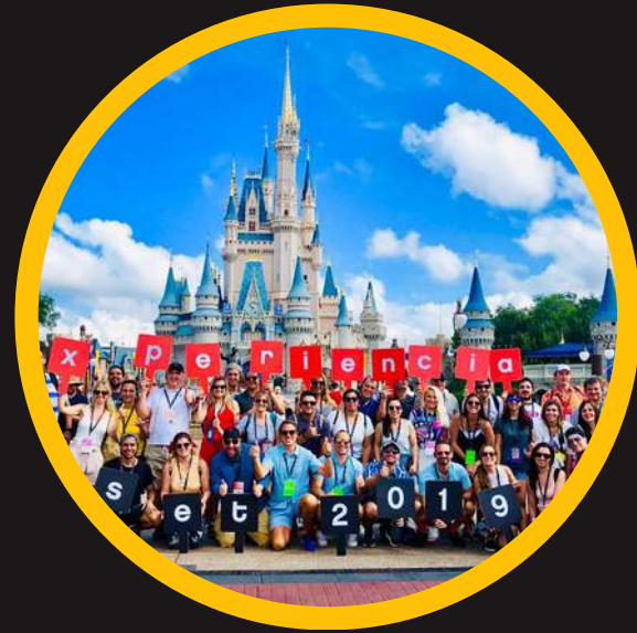
Edición 1 sep 2019

Somos la empresa en LatAm que mayor cantidad de ejecutivos llevó a estudiar