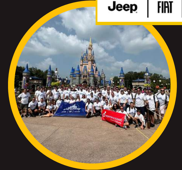
Edición 16 oct 2023 incompany Jeep • Fiat • RAM