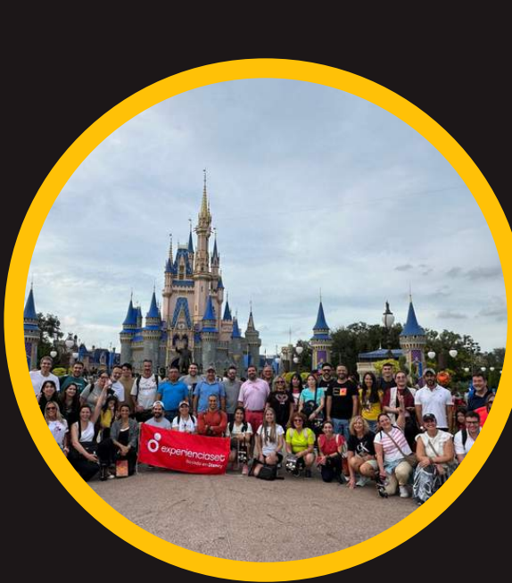
Edición 18 oct 2023