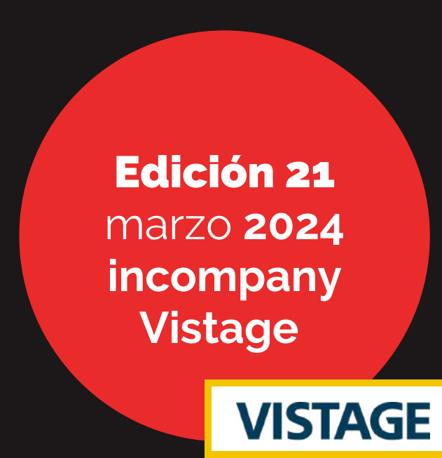
Edición 21 marzo 2024 incompany Vistage