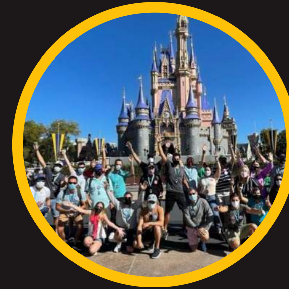
Edición 4 mar 2021