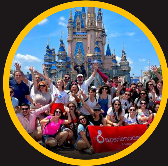
Edición 11 jun 2022

Reconocidos como los traductores de la cultura Disney® al mundo empresario LatAm.