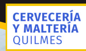
Edición 19 oct 2023 incompany Cerveceria Quilmes