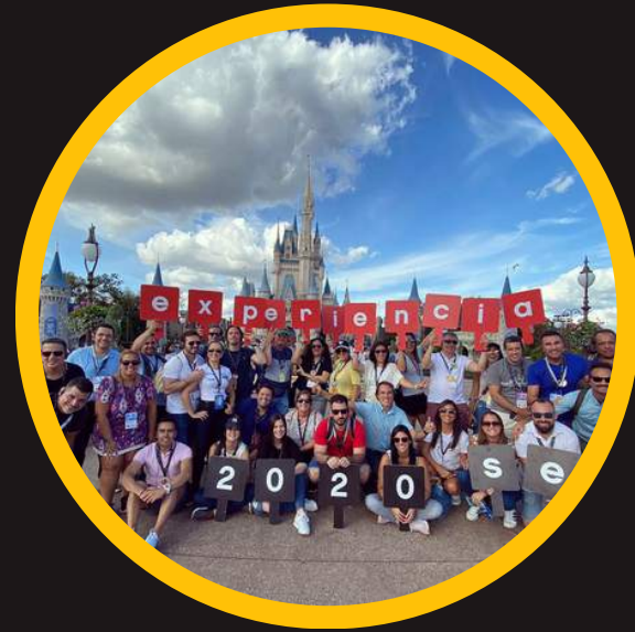
Edición 2 feb 2020