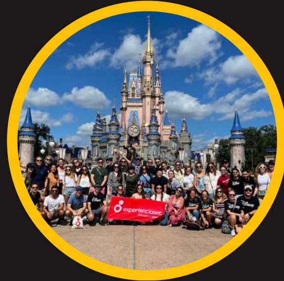
Edición 12 oct 2022