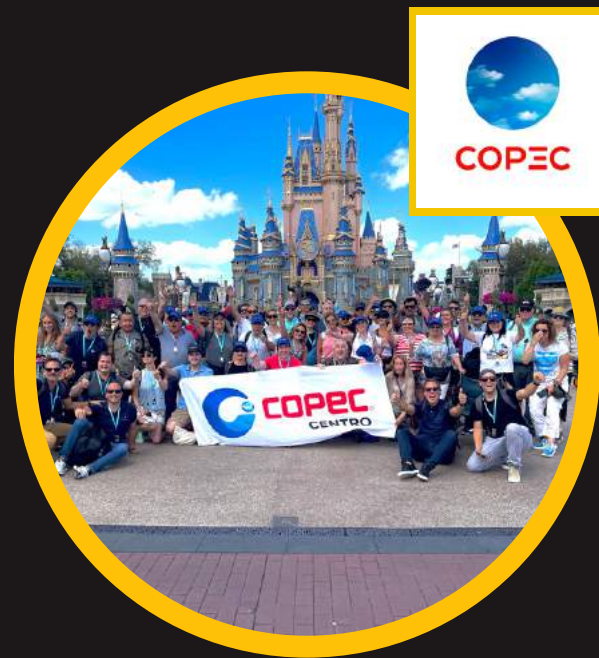
Edición 7 mar 2022 1ro COPEC