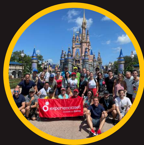
Edición 6 sept 2021