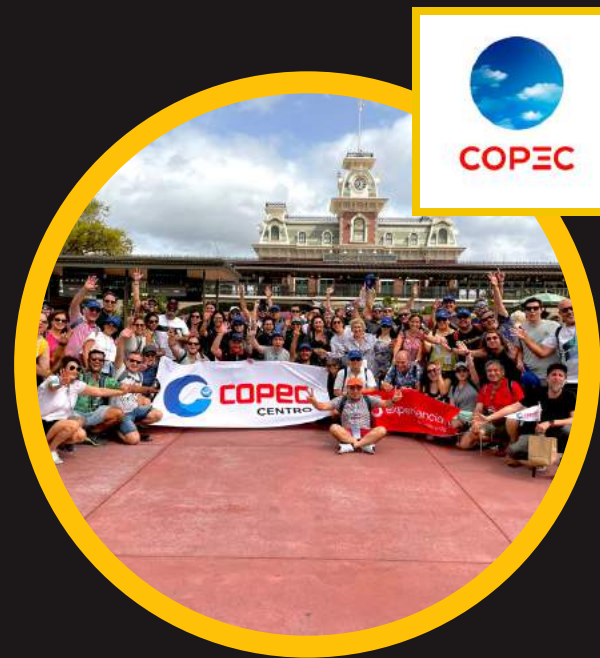
Edición 9 abr 2022 2do COPEC