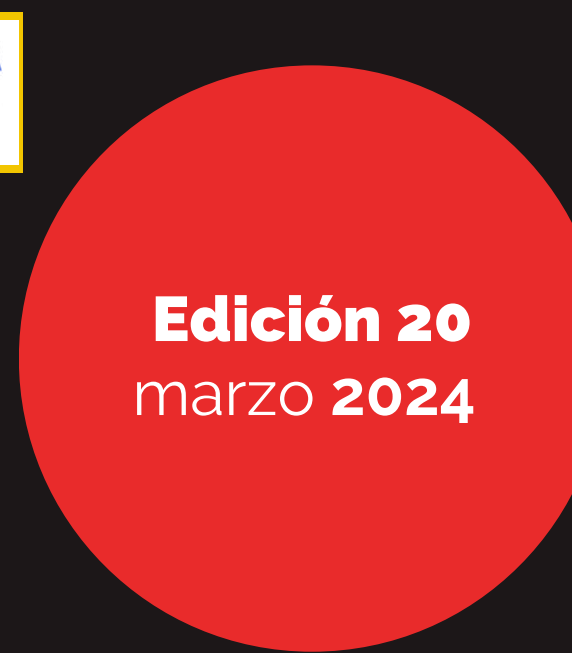
Edición 20 marzo 2024