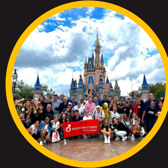
Edición 15 jun 2023