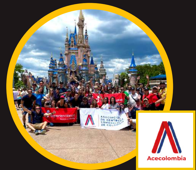
Edición 10 may 2022 incompany Acecolombia